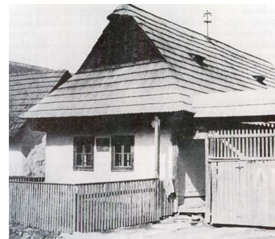
Rodný dom Martina Kukučina v Jasenovej – záber z roku 1958